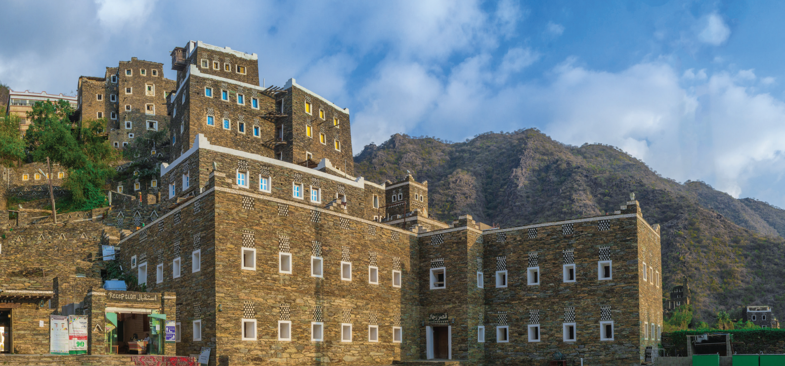
↑ Деревня Риджал Альма в округе Асир