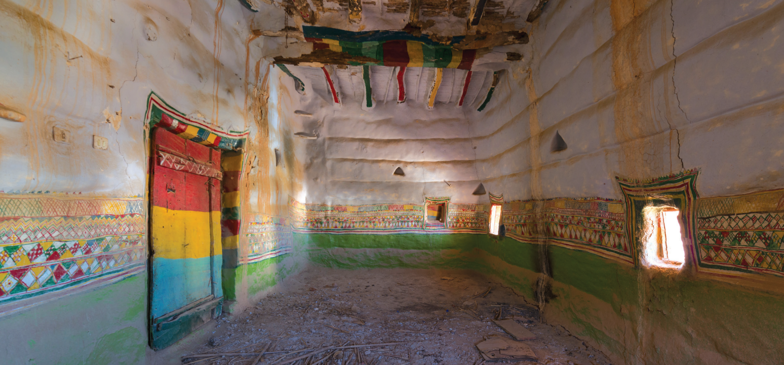
Ⓜ Аль-Катт аль-Асири, традиционная роспись стен женщинами в округе Асир